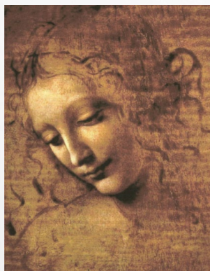
Leonardo da Vinci (1452-1519)